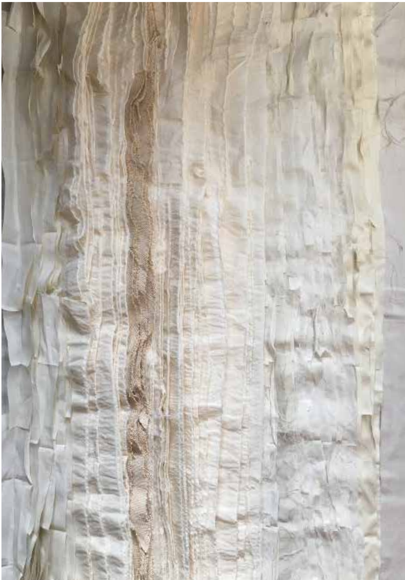
The labyrinth of passions . Joël Andrianomearisoa . Tessile . 2017