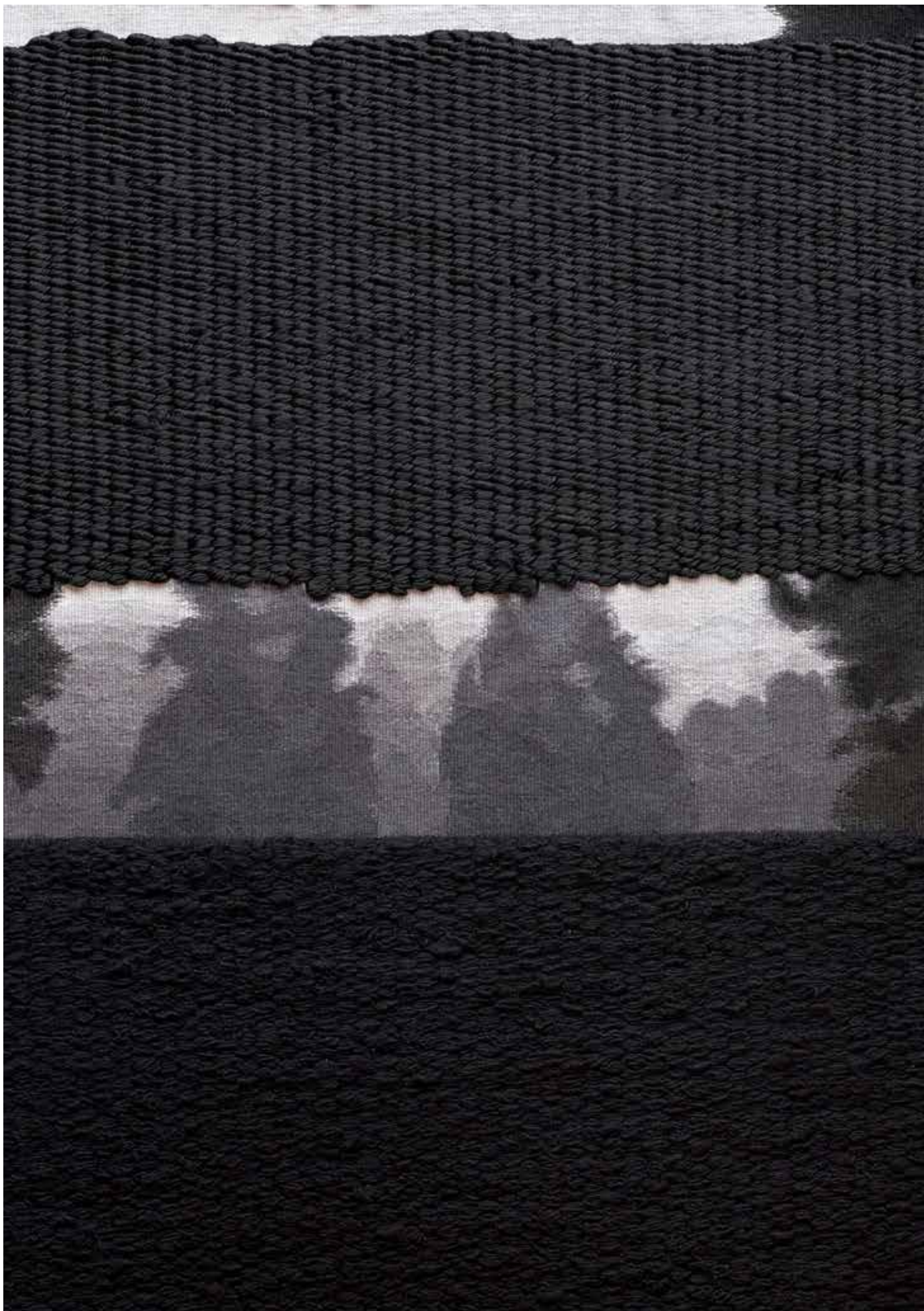
Nous n'avons pas fini de nous parler d'amour . Joël Andrianomearisoa Arazzo di Aubusson . Tessile, lana, fibre vegetali e sintetiche . 2018